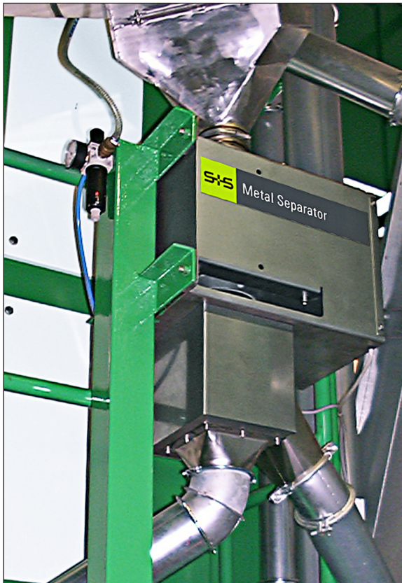
Einbaubeispiel: Der Metall-Separator RAPID 4000 eingesetzt zur Qualitätssicherung bei der Abfüllung von getrocknetem Gemüse (alte Ausführung)